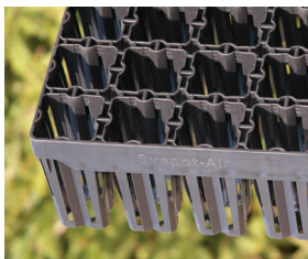
Öppen kassett Svepot Air

I våra öppna system styrs rötterna mot slitsar i krukväggen där rötterna beskärs när de kommer i kontakt med luften mellan krukorna. Detta ökar antalet aktiva rotspetsar vilket ger plantorna ett väl förgrenat rotsystem och en snabbare etablering på hygget.