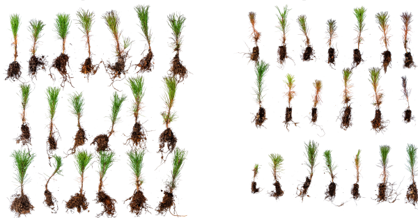
Tallplantor (krukvolum 30 cm 3 ) planterade i maj 2018 i Hälsingland. Skördade i oktober samma år. Notera den kraftfullt förbättrade rotutvecklingen och de längre sekundärbarrarna på arGrow® granulat behandlade plantor till vänster i bild.